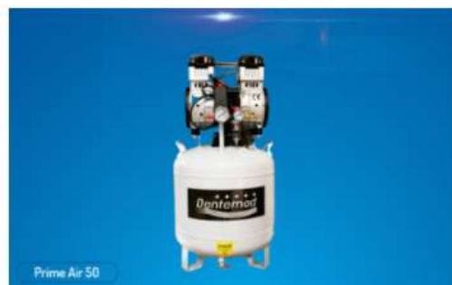
Compressor Prime Air 50 litros Compressores