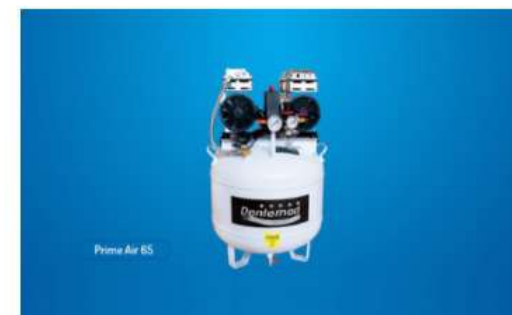
Compressor Prime Air 65 litros Compressores

Ativar o Windows Acesse as configurações do computador para ativar o Windows. Fale conosco, nós estamos online!