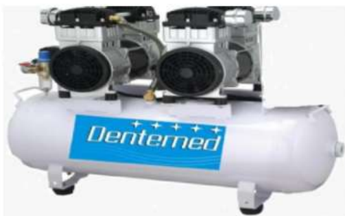
Compressor Prime Air 120 litros Compressores