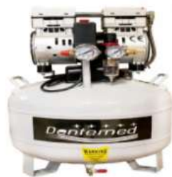
Compressor Prime Air 40 litros Compressores